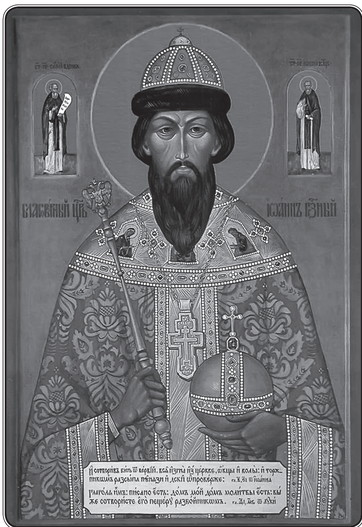
Икона Благоверного и Христолюбивого Царя Иоанна Грозного

«Несть свят, якоже Ты, Господи Боже мой, вознесый рог верных Твоих, Блаже, и утвердивый нас на камени исповедания Твоего».