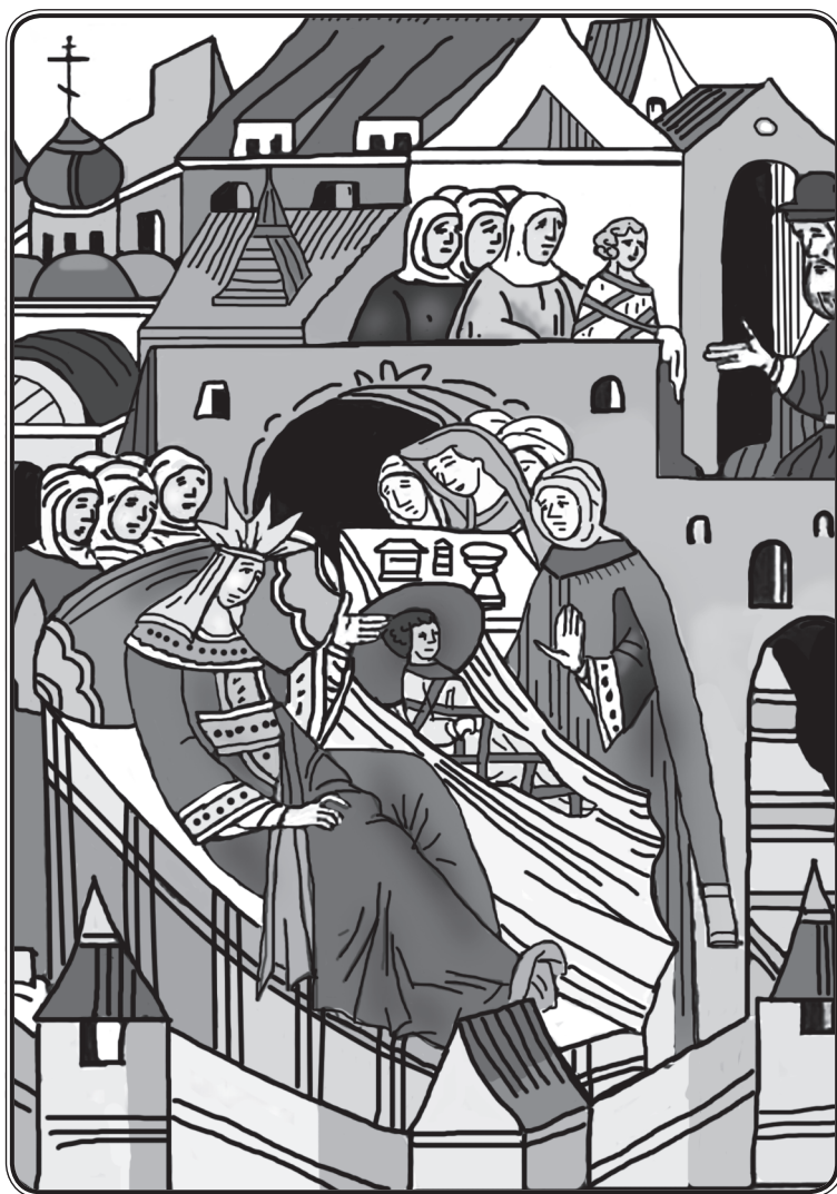
Рождение Ивана Грозного.

Традиция крепла, а в XV веке торжествовала уже. Иван Калита, его личность и политика — прототип московских князей вплоть до самого Грозного. Ничего великого, выдающегося, ничего блестящего. Природа поскупилась на краски, создавая этого князя-хозяина и князя-помещика, скупого, медленного, хитрого, неуклонно стремящегося к поставленной цели. О невозможном он не мечтал, как не мечтал о геройских подвигах и славе. Каждая копейка у него на счету. Что приобретено им, приобретено навеки. Как настоящий практик, человек маленькой действительности, он пользуется всякой ошибкой ближнего, идет на унижения, когда это нужно, неумолим и непреклонен, раз сила на его стороне. Его борьба с тверским князем не только не говорит нам о благородстве его души, а прямо наоборот. Зато дипломатической тонкости сколько угодно. Бедный Александр и не заметил, как ловко расставили вокруг него сети и как неожиданно и безысходно попался он в них.