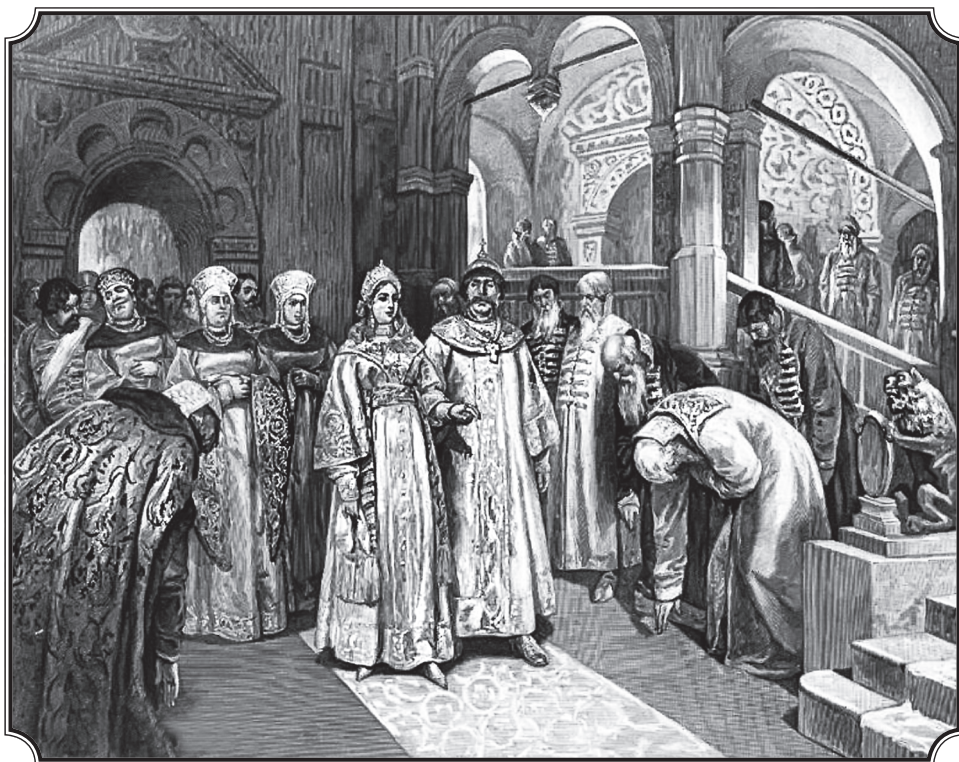
Клавдий Лебедев. Василий III, великий князь Московский, вводит во дворец невесту свою, Елену Глинскую. 1915 г.

Грозному было несколько месяцев, когда умер его отец, и с небольшим три года, когда умерла или была отравлена его мать — Елена Глинская, супруга Василия III. Ребенок остался без надзора и руководства. Все делалось