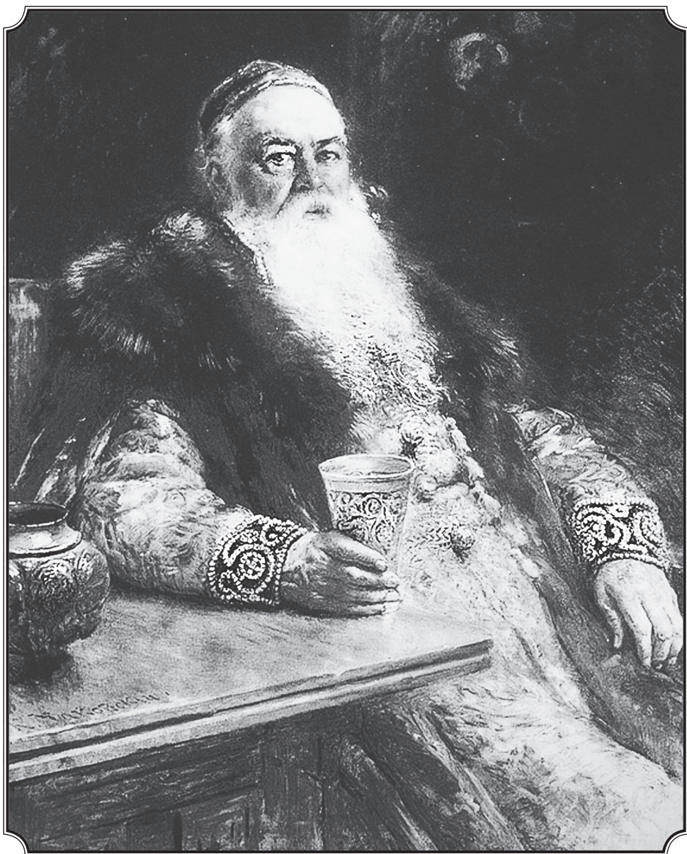
Константин Маковский. Боярин с кубком. 1915 г.

Они льстили его тщеславию. Он задумал устроить то же самое и у себя в Москве. Мало того, проникнутый мыслью о собственном величии, причем его пылкое воображение рисовало ему полученную им власть самыми неумеренными красками, он в громком титуле царя искал внешнего выражения своих претензий. Как бы то ни было, 17 декабря 1546 года было приказано собраться двору. Митрополит, бояре, все знатные сановники окружали Иоанна, который, помолчав, сказал: «Уповаю на милость Божию и на святых заступников земли Русской, имею намерение жениться: ты, отче (митрополит), благослови меня. Первою моею мыслью было искать невесты в иных царствах, но, рассудив основательнее, отлагаю сию мысль. Во младенчестве лишенный родителей