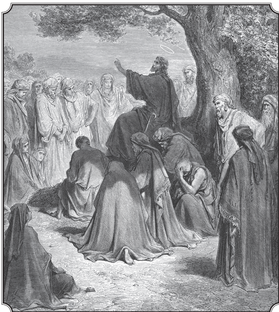
Гюстав Доре. Иисус учит народ.

Ангел святой, посланник грозный! Избавь и меня от жизни суетной этой.