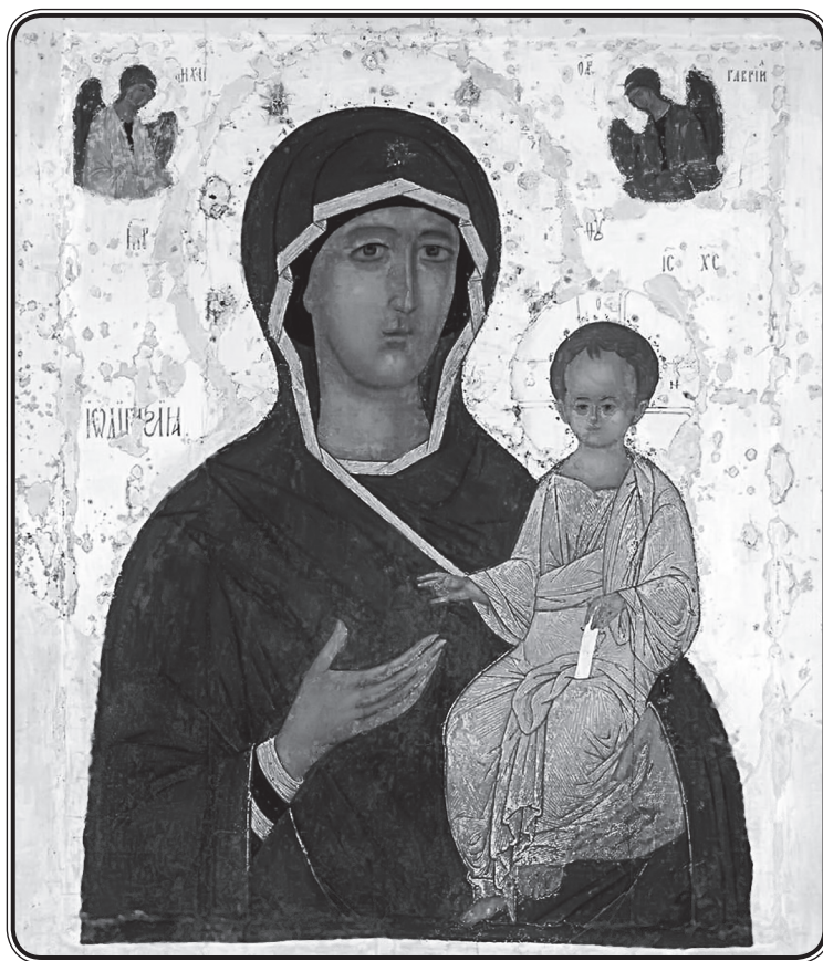
Дионисий. Смоленская икона Божией Матери 1482 г.

От небесных сил избранного воеводу, от Бога посланного мудрого воина и грозного ратника и победителя вражьих сил, святого ангела, воспевая, хвалим. Он в смерти за нами надзирает и от суеты мира избавляет, и на суд праведный к Христу представляет, и от вечных мук избавляет.